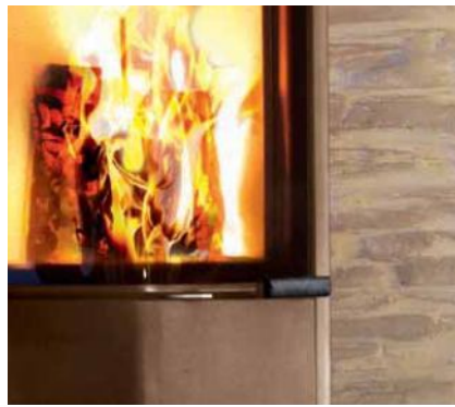
Cubo L – RLA, Terra optional mit Holzfach als Anbauteil aus 8 mm massivem Stahl (Holzfach wahlweise auf der rechten oder linken Seite und in zwei Abmessungen möglich)