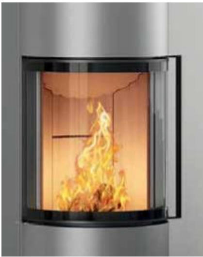
Passo L, Edelstahl Relinggriff in schwarz