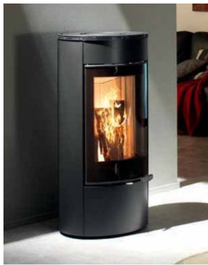
Senso S - RLA , Graphit Griffausführung in Edelstahl (Standardgriff schwarz)