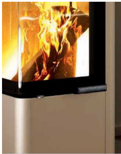
Cubo S – RLU, Perle