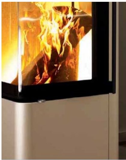
Cubo S – RLA, Perle